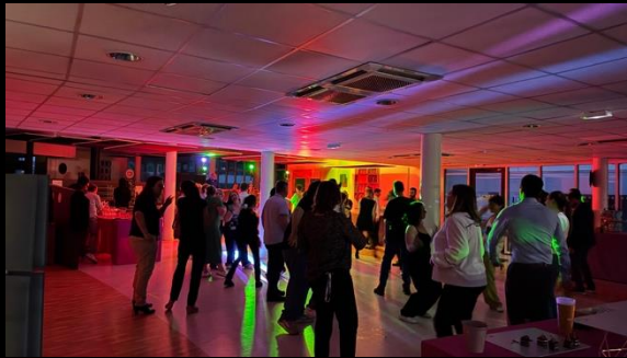
Prestation son et lumière pour une soirée d'entreprise.