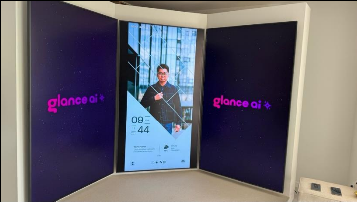
Création et mise en place d'un Kiosque d'affichage de Mode pour le Lions à Cannes